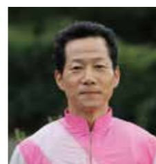
TOSHIHIRO NISHIGAWA 西川 敏弘 [大関 吉明/高知県出身]