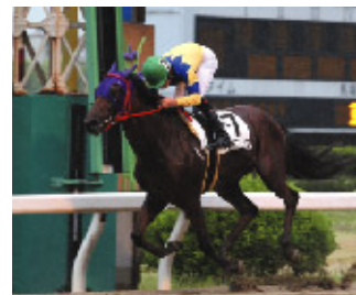
2007年 マルヨフェニックス