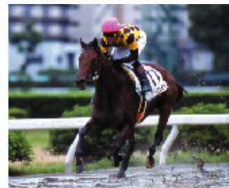
2006年 ホウライミサイル