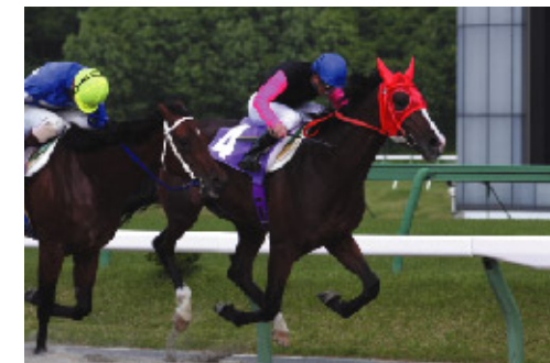
第28回 岩手ダービー ダイヤモンドカップ 2008年6月2日(月) 盛岡競馬場 2,000m ゴールデンクreek

盛岡競馬場のダートは軽く、パワータイプが強い水沢競馬場と比べると、スピードのあるタイプのほうが活躍できる。しかしこの2000メートルは別。4コーナーのポケットからスタートして、高低差1.5メートルの坂がある直線を2度走るタフなコース。盛岡で行われた過去2年の連対馬すべてが、4コーナーで3番手以内につけていた馬。逃げ・先行馬や早めに進出した馬が直線でも粘っている。直線の坂の影響か、差し・追い込みは決まりにくい。枠順では内外枠でそれほど差はない。とにかく先手をとれる馬が断然有利。